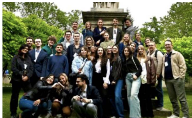
Das dritte internationale Youth Camp fand vom 31. Juli bis 4. August in Bukarest statt.