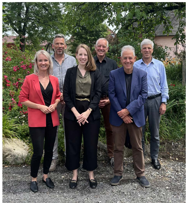
Stiftungsrat mit Geschäftsführung im Berichtsjahr 2024