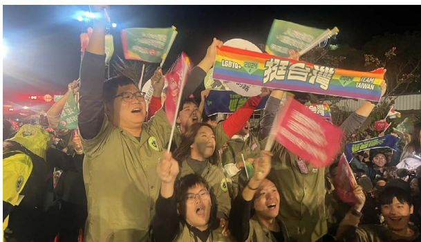
Auch die Präsidentschafts- und Parlamentswahlen in Taiwan Anfang Jahr wurden von der Schweizer Demokratie Stiftung eng begleitet und ausgewertet.

Vor dem Hintergrund des Superwahljahres organisierte die Schweizer Demokratie Stiftung zusammen mit der taiwanesischen Vertretung in der Schweiz im Januar eine Veranstaltung zur Einordnung der Wahlergebnisse in Taiwan. Im Mai 2024 folgte die zwölfte Ausgabe des Global Forum on Modern Direct Democracy in Bukarest – zum ersten Mal in Osteuropa und kurz vor den Wahlen zum Europäischen Parlament sowie vor bedeutenden nationalen Wahlen. Mehrere hundert