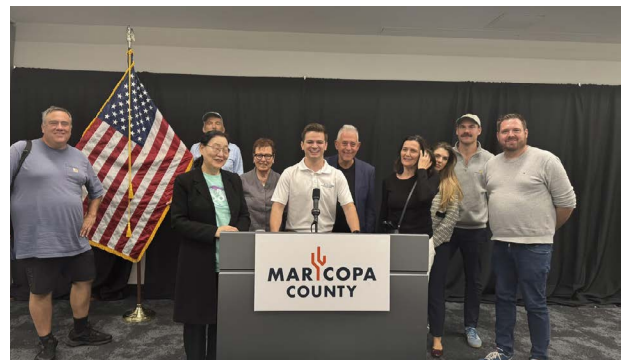
Die internationale Delegation besuchte einen der grössten und spannendsten Wahlkreise der USA, das Maricopa County in Arizona.

Die Schweizer Demokratie Stiftung blickt auf ein ereignisreiches Jahr zurück. Ein Jahr, in dem mehr Menschen als je zuvor an die Wahl- und Abstimmungsurnen gerufen wurden. Gegen zwei Milliarden Bürger:innen in fast 80 Ländern konnten an der Urne mitentscheiden. Das Superwahljahr begann mit der richtungsweisenden Wahl in Taiwan. Weitere weltpolitisch relevante Wahlen waren jene in Indien, im bevölkerungsreichsten Land der Erde, und in der Europäischen Union. Nicht zuletzt war die turbulente Präsidentschaftswahl in den Vereinigten Staaten von Amerika ein Höhepunkt dieses Jahres. Die Schweizer Demokratie Stiftung war mit einer Studienreise in drei von sieben Swingstaaten vor Ort und erlebte auch die Auftritte von Kamala Harris und Donald Trump in Las Vegas live mit. Der globale Kontext macht deutlich, wie wichtig die Arbeit und der Beitrag der Schweizer Demokratie Stiftung als Schweizer Anker der weltweiten Demokratieförderung ist – speziell nach dem Wahlsieg der Republikaner, die nun nicht nur das Weisse Haus, sondern auch die beiden Kammern des Kongresses kontrollieren.